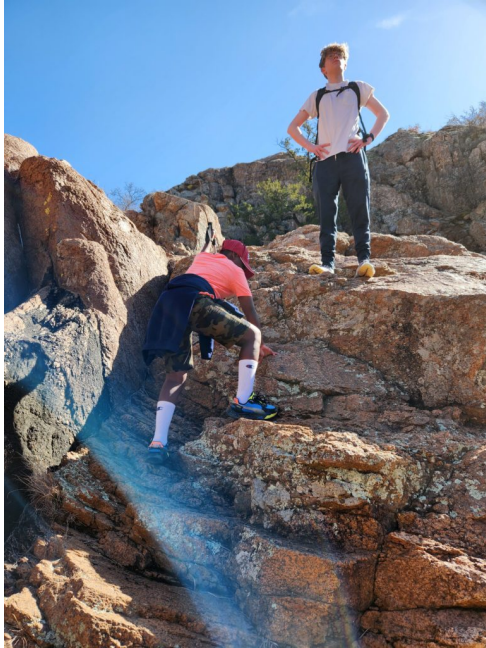
Wichita Mountains Wildlife Refuge

与大多数事情一样，在带着孩子远足时，计划是成功的关键。如果你的孩子是新手，起初可能会有些挑战。以下是一些有助于你与孩子度过美好秋日徒步之旅的建议：